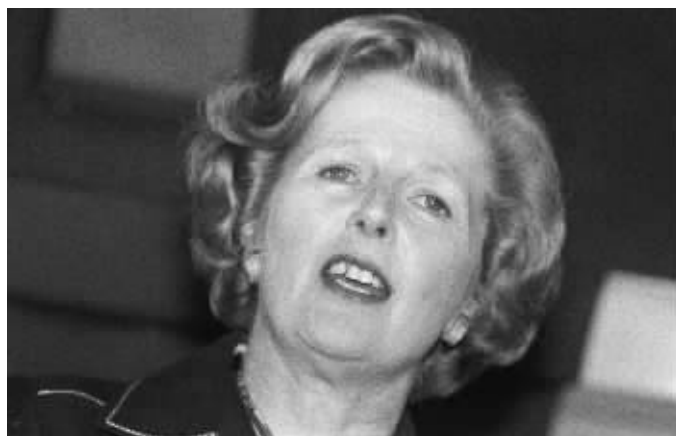
英国前首相玛格丽特·撒切尔

1982年9月,撒切尔夫人访问中国,是英国政府首脑首访新中国。英国剑桥大学撒切尔档案馆22日公开一些前首相玛格丽特·撒切尔夫人的私人文件,提及“铁娘子”1982年首访中国时面临的一些纠结。