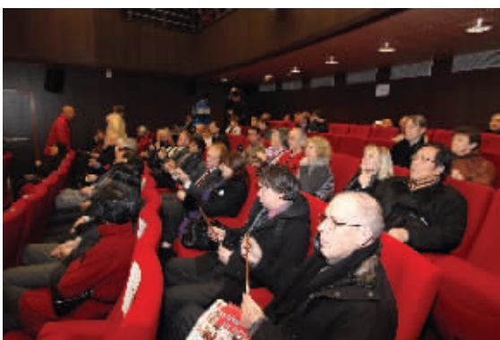
讲座现场观众每人拿到一支毛笔