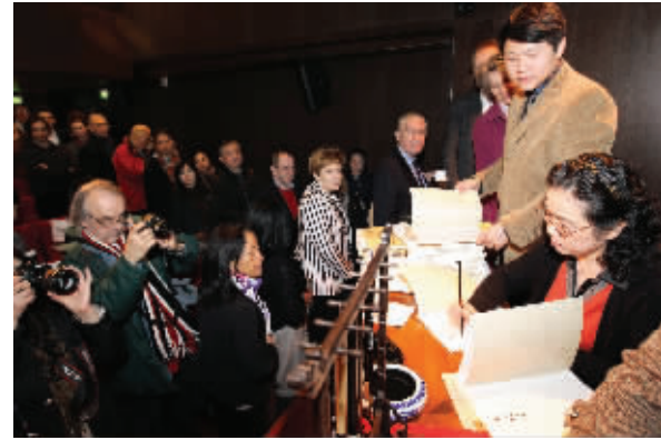
孙晓云为观众现场签名赠书