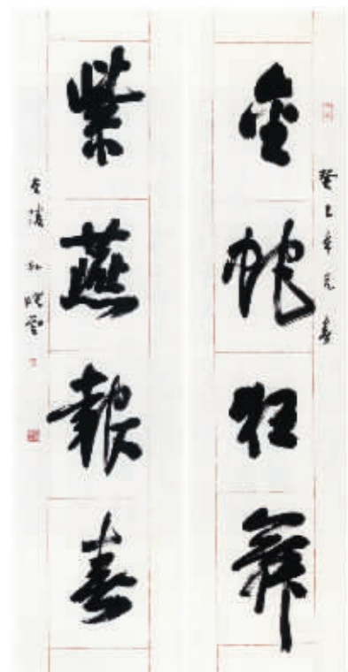
《金蛇狂舞 紫燕报春》