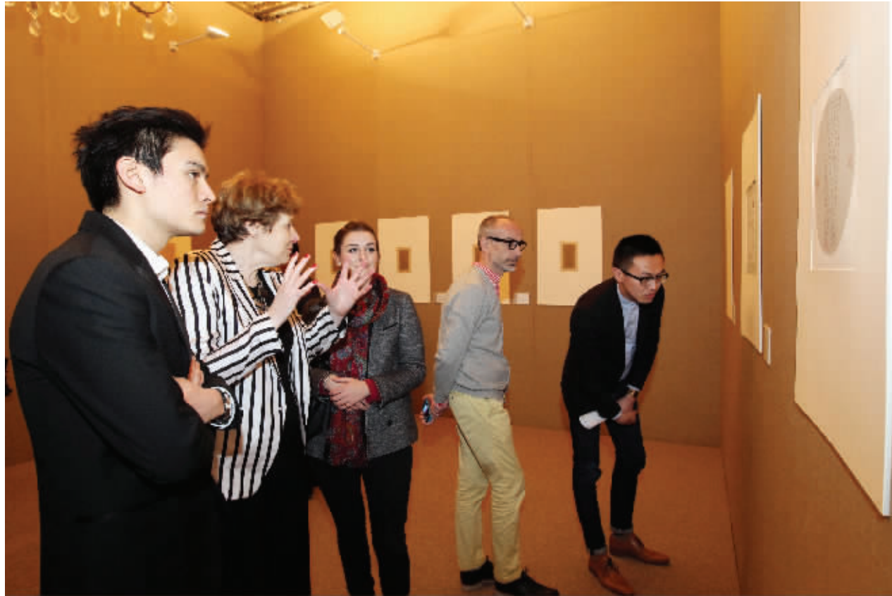
“书法有法”展览现场吸引了很多法国观众