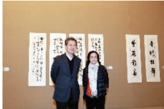
中国驻法国大使孔泉参观孙晓云展览