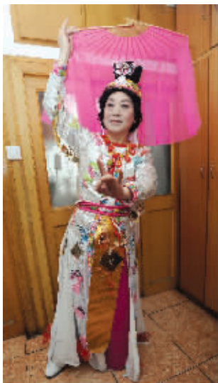
张老为“梁山伯”设计的戏服