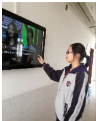
学生在课间使用大屏幕 交互空间’,也可以看《一站到底》、《我是歌手》。”信息中心的老师控制着开关,学生可以上校园

雨花台中学副校长周茜说,新一代的学生被称为“ME”一代,指的是他们熟悉移动的工具“M”(mobile),也熟悉各种各样电子交流的手段“E”(electronic)。学生将这些“口袋中的互联网”带到教室里去,打造了更多的网络学习空间。本学期开始,学校还在校园设置了电脑显示屏,学生在课间和午间可以上网。“可以点‘师生