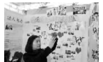
南京协作者社区发展中心展区

值得关注的是,南京市民政局拟在各区的婚姻登记处设立婚姻家庭辅导中心。“近年来,南京的离婚率一直在攀升,80后频现‘闪婚’‘闪离’。曾有一对小夫妻结婚不到两年,来婚姻登记处4次,结了离,离了又复。如果有人能在夫妻吵架时拉上一把,离婚的比例或许会下降很多。”南京市民政局福事处处长周新华向现代快报记者透露,南京民政部门打算在各个区配备婚姻家庭辅导员,通过政府购买服务、招募志愿者等形式,对婚姻出现危机的家庭进行疏导。