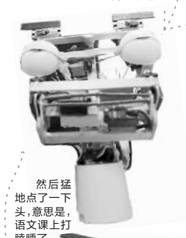
然后猛地点了一下头,意思是,语文课上打瞌睡了