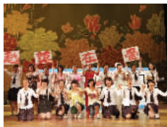
艺术节:挖掘职业生活的美