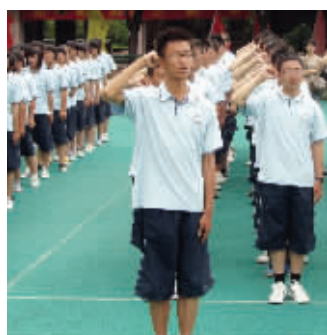
入学宣誓:别样的新起点