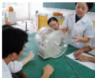
药学组教师在上课