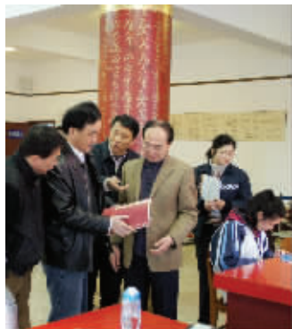
省教育厅杨湘宁副厅长莅临莫愁中专调研实训基地建设