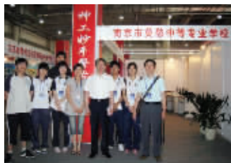
在全国中等职业学校学生技能作品展洽会上,沈健厅长与我校参展师生合影