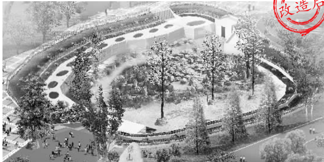
新猴山效果图