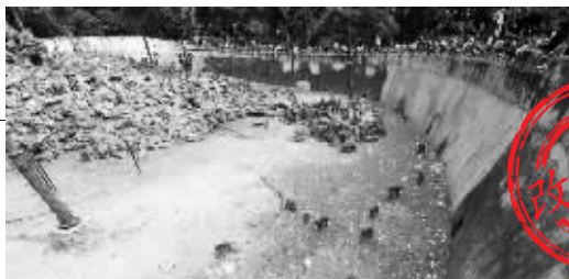
红山动物园猴山即将改造