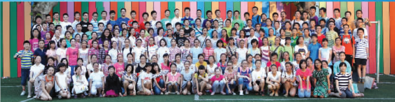
图为2013年南外录取乐灵部分学员合影