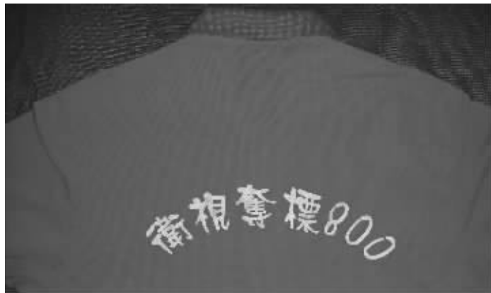
江苏卫视“夺标800”现场观摩开奖方阵

自江苏体彩开展老物件征集活动以来,各类老物件层出不穷,截至目前,全省已有一百多位彩友展示了自己心爱的藏品。除了“收藏量”最多的彩票票外,各类体彩“衍生物”也悉数出现,这些在旁人看来不起眼的藏品,在一些体彩忠实粉丝的眼中却是“稀世珍宝”。