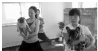
日本流行带狗练瑜伽