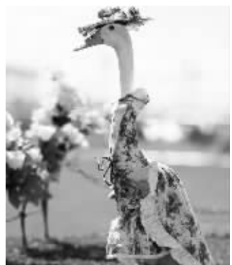
哈林顿的鸭每只都很时尚

据英国《每日邮报》报道 人对宠物究竟可以宠到何种地步,以下的报道也许会让你有所了解。