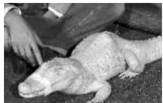
比诺正在接受针灸治疗

据英国《每日邮报》报道 白化鳄鱼比诺命运多舛,8年前它一出生就患有驼背和脊柱侧凸。