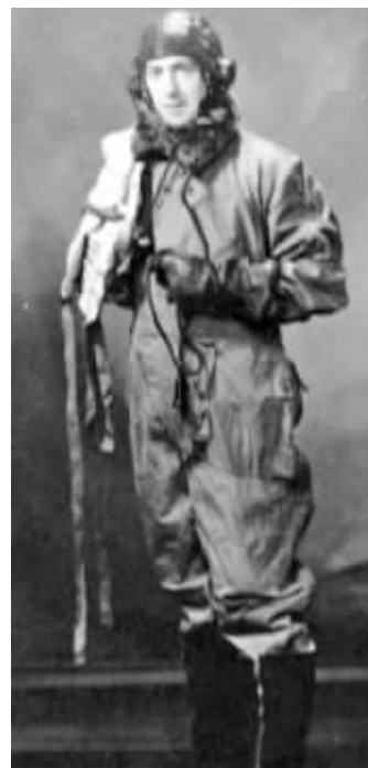
斯塔福德曾是英国皇家空军飞行员