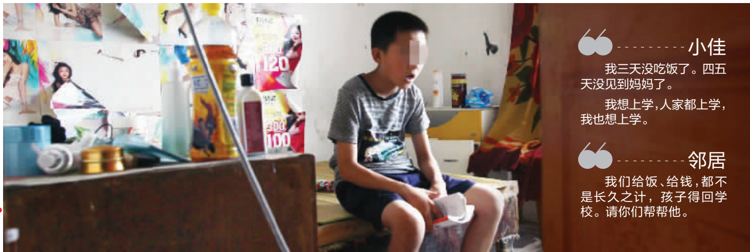
昨天,在南京迈皋桥十字街附近的出租屋内,小佳在等待妈妈回家