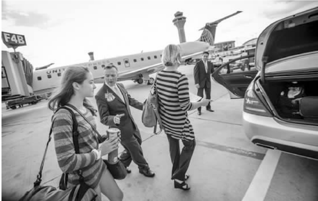
在美国芝加哥某机场,航空公司工作人员招呼刚下飞机的精英俱乐部旅客坐进奔驰轿车

“环球服务计划”俱乐部不对外公开,只有受邀者才能参加。它邀请的对象是一些世界顶尖的商旅人士——那些每年累积的飞行里程通常达到数十万英里、对航空公司最有价值的旅客。