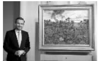
梵高博物馆经理向外界介绍《蒙特马约的日落》

荷兰梵高博物馆9日宣布发现油画《蒙特马约的日落》,据信由梵高1888年至1889年间在法国南部阿尔勒创作。