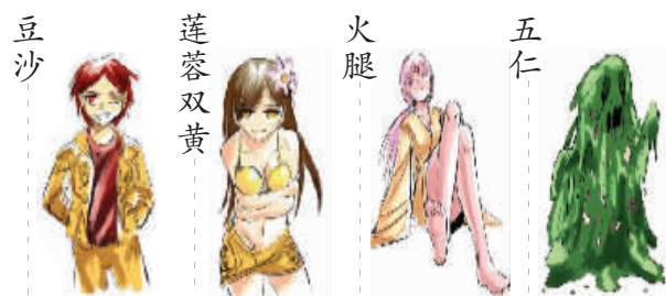
网友用漫画拟人月饼家族,大家都帅气、靓丽,只有五仁……

去年,网友们吐槽奇葩月饼的声音似乎仍在耳边,今年,他们将“火力”直接对准五仁月饼,高呼,“五仁滚(出)粗月饼界!”尽管如此,这一最经典月饼口味依旧得到不少人的力挺,“不能这么残忍对五仁,水果豆沙莲蓉才该滚出。”