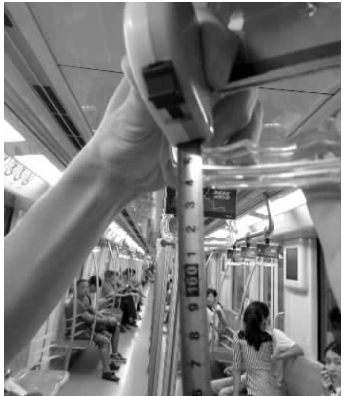
南京地铁车厢内拉手高度约165厘米

包括江苏在内的东南区女性依然排在第三,平均身高、体重和胸围分别是:1575毫米,51千克,831毫米。