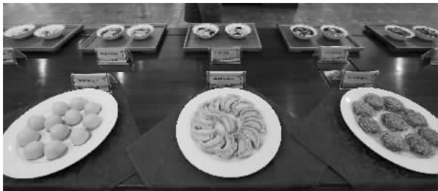
各色秦淮小吃非常精致