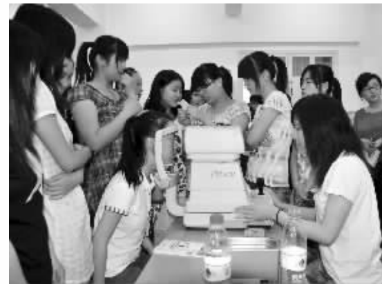
计量服务进校园活动