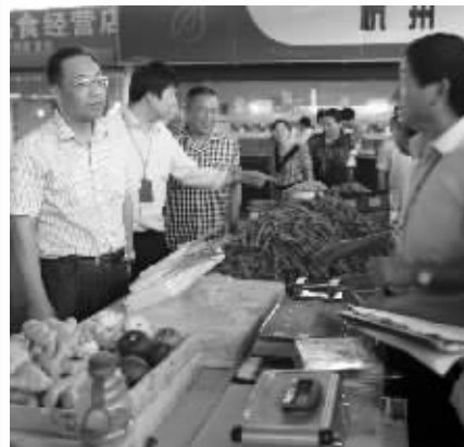
质监局工作人员在集贸市场检查计量器具