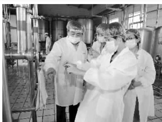
质监人员检查食品企业