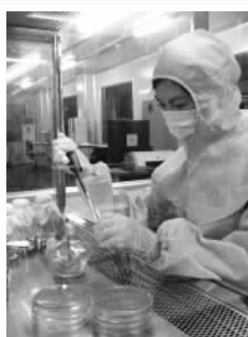
无锡市质检中心的食品实验室