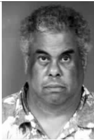
现在的凯斯·卡库加瓦