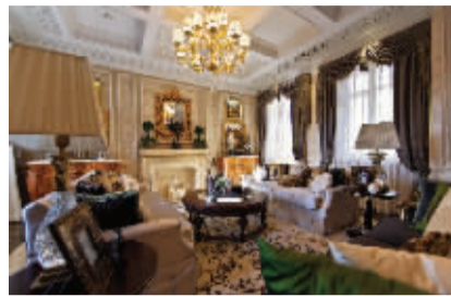
爱华装饰设计作品