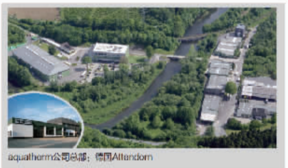
aquatherm 公司总部: 德国 Allendorf

针对日益发展的中国市场, 德国 aquatherm GmbH 从 2013 年 7 月 1 日起正式启用官方持有的中文标识“阔盛”用于中国区市场推广。