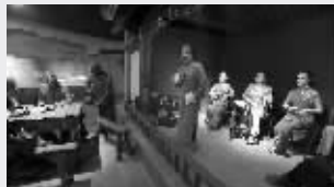
老城南记忆馆南京风味足