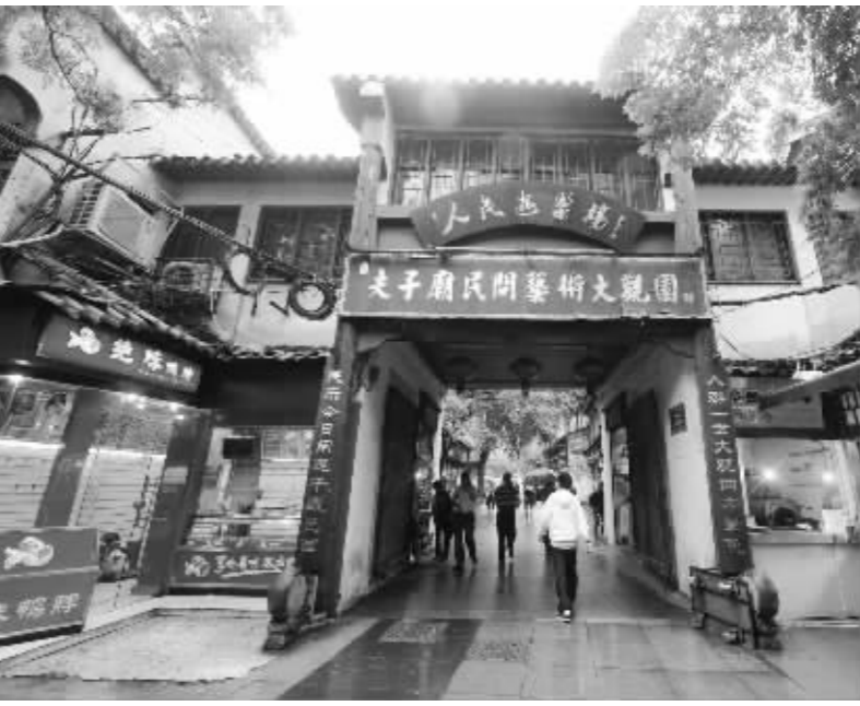
如今的人民游乐场已大变革