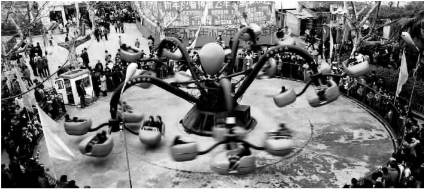
上世纪七八十年代南京市工人文化宫里的旋转车

民国时期,南京还多次举办风筝比赛,1928年清明节,国民政府行政院在雨花台举办南京风筝比赛,有近百只风筝参加。在南京图书馆查找老照片时,记者欣喜地看到了民国风筝大赛的照片。新中国成立后,在夫子庙、中华门、玄武门一带还居住着许多风筝世家。