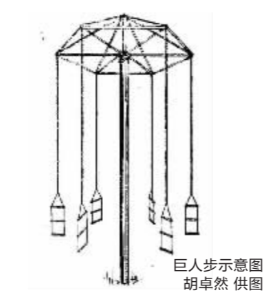
巨人步示意图

有更详细的资料显示,鼓楼公园儿童游乐园“内建有滑梯一架,秋千三种,每种一架,跷跷板二架,休息亭一座,转盘一架,巨人步一架,独木桥二架,沙盘两个,国旗柱一”,“转盘”“巨人步”“沙盘”都是儿童游乐设施。“巨人步”听上去有点像今天的惊险项目,据有关记载可知,“巨人步”由一根高耸的铁柱和几根