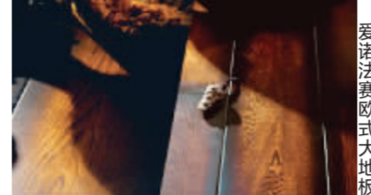
爱诺法赛欧式大地板

18年前,木地板还被国人称作“奢侈品”;18年后,木地板已经成为家庭装修的“必需品”。木地板能给人以温暖和舒适之感,这也是中国人“实木情结”的原因所在。