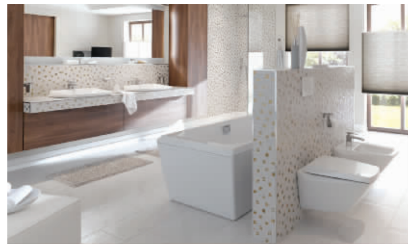
TOTO卫浴晶钻系列马桶