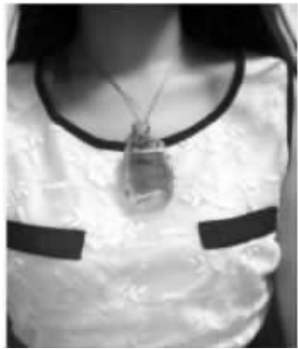
微博“炫富大赛”上,一网友晒出自己祖传的超大祖母绿项链

经常看到自己空间一些同学朋友发的说说充斥着炫耀内容,或拐弯、或装作不经意地、或赤裸裸地炫富。真是煞费苦心了。楼主不是羡慕嫉妒恨,只是大家都这么熟了,都知道家底几分,就不要装了好嘛。不过楼主已把这些作为无聊消遣时的段子来看。