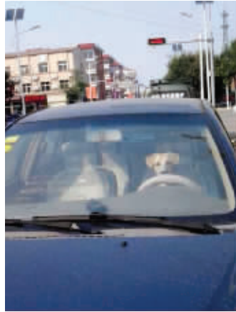
04 “你车谁开去洗的呀?”同事说,是他家狗开去的。