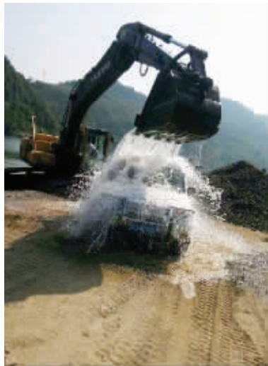
03 我说:你的汽车呢?同事说:车开去洗了。