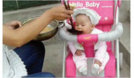
06 话说,养狗容易,养孩子不简单,看这孩子食量大的。