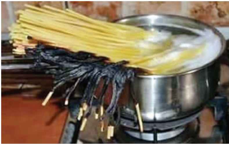
01 早上起来煮碗面,结果把面烧焦了,杯具!