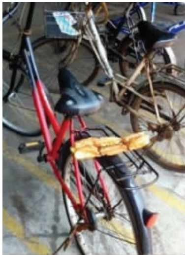
02 让同事带早餐,看到这一幕当时我就233了。