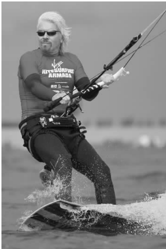
维珍航空公司老板布兰森在海浪中表演

布兰森所拥有的内克岛目前可让人租住,而且租金不菲。租住整个内克岛一晚收费约6万美元,可供最多30名成人入住,另有租住个别度假别墅的服务。布兰森平时喜爱广邀名人好友到小岛入住,已故英国戴妃、威廉和哈里王子等皇室成员也曾获招待。2011年8月,该岛有豪宅被雷电击中,发生大火连烧3天,直到不久前才完成重建。