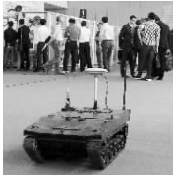
履带式多任务通用移动机器人