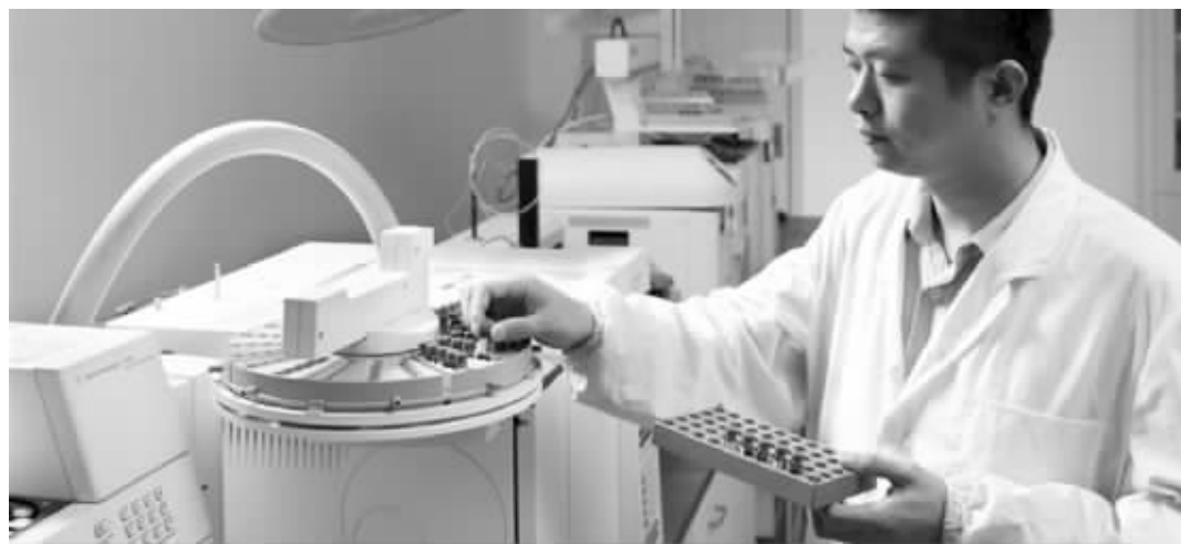
工作人员在对水质进行检测

近日,一名苏州网友发布微博感叹:水质净化器白买了!他的朋友把苏州的自来水带到日本检测,结果“出人意料”——达到日本饮用水标准。昨天,现代快报记者联系上了这名网友,得知自来水样本取自苏州工业园区,检测结果也是出自日本的权威检测部门,是按照日本的标准进行检测的。苏州市工业园区清源华衍水务有限公司相关负责人表示,园区自来水水源地在太湖,出厂水要经过106项指标的检测,是能够达到直饮标准的。