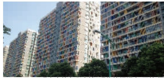
现实中的七彩大楼

这张图被发布后,立刻引来了网友的热议。不少网友称,“亮瞎了!”网友“无锡都是无锡人”“甜圈圈66”等网友都表示,大楼看上去很漂亮。也有人觉得大楼的颜色太鲜艳,让人看得眼花,甚至有网友觉得这种太花哨的颜色,显得有些恶俗。