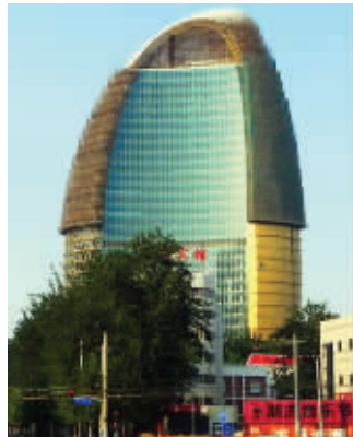
目前“土豪金”的外观