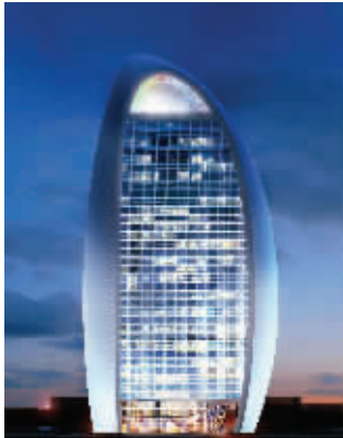
建成后的人民日报大楼效果图

近日,正在施工中的人民日报新大楼再次引起网友关注。从网友发布的照片可看到,整栋建筑自上而下披着一层金黄色的外衣,被网友称之为“土豪金”。这个奇特的造型瞬间引爆网络,“披上一层‘土豪金’,人民日报新大楼真是霸气!”;还有网友吐槽,“不看脑袋确实像个玉米棒子”。