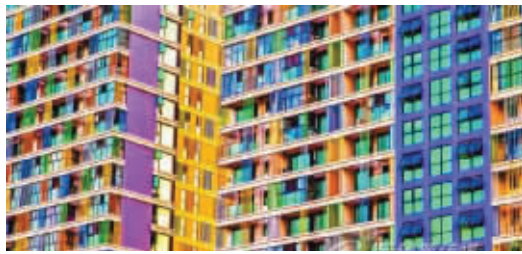
网传七彩大楼的梦幻外观