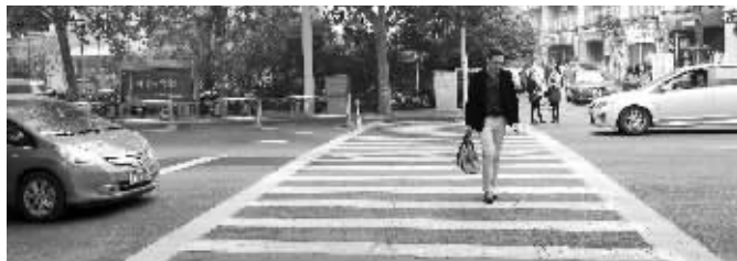
昨日抄纸巷路口,许多车辆礼让斑马线