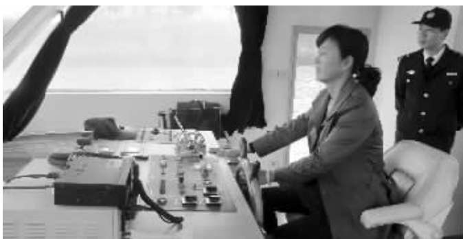
学员正在进行实操考试

与以往船员为清一色男性不同,普通女性在这一行开始崭露头角。今年,常州地区参加统考的船员达500名,其中女性越来越多。 常海事 王玉