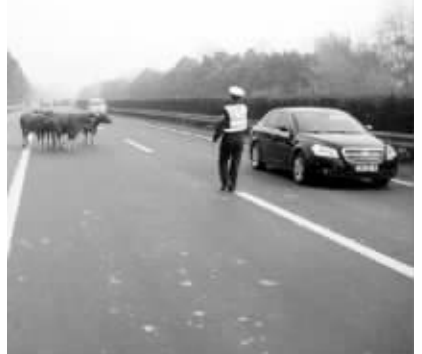
民警在高速上赶牛

按理说,高速公路都是全封闭的,牛怎么能上来呢?对此,民警也很纳闷。“这几头牛既不是水牛,也不是黄牛,在江宁这边比较少见。”民警分析,这几头牛可能是从高速