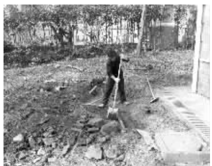
施工工人清理管道旁边的土

后表示,按照规定,施工方事先应找来地下管线图再进行施工。施工队负责人也承认,他们在施工前并没有拿到地下管网图。“本想这个工程并不大,也不会往地下挖太深,没想到却碰到了天然气管道。”昨天下午,被挖断的天然气管道已修复。