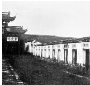
当年的考棚 资料图片