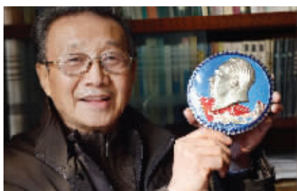
南京长江大桥钢梁合龙纪念章