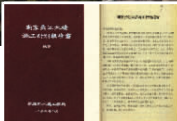
江苏档案馆保管的南京长江大桥施工设计报告书及南京长江大桥示意图