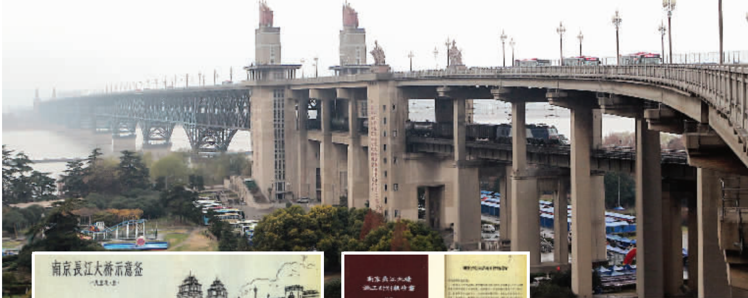
南京长江大桥45岁了