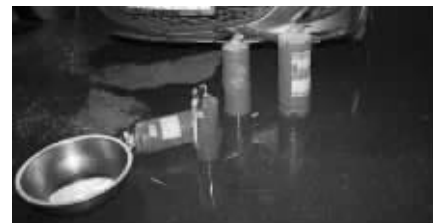
店里有灭火器却没人会用

快报讯(记者 孙玉春)28日下午5点多,三牌楼大街一家饭店突发大火,店里几乎被烧光。让人想不到的是,店老板称自己在刚起火时拿出灭火器,却不会使用,白白浪费了灭火的时机;而且,是锅里的油着火,大家却用水来浇,导致火势进一步扩散。