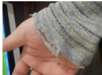
“存钱哥”网上晒破掉的短裤和衣袖