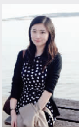
美女博士小王 本人供图