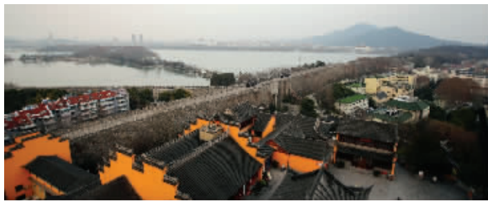
明城墙解放门台城段