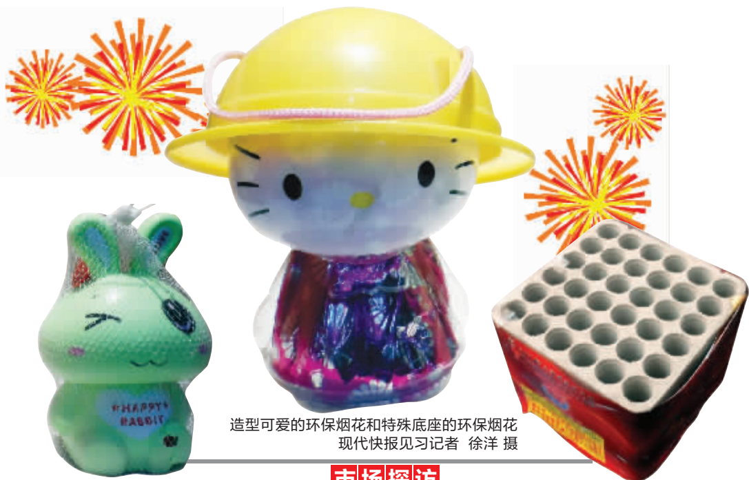
造型可爱的环保烟花和特殊底座的环保烟花

在赵薇的微博中,提到了丁达尔效应,并将它当成了一种恶劣的空气现象。而实际上,丁达尔效应在中学化学书上有过介绍:当一束光线透过胶体,从入射光的垂直方向可以观察到胶体里出现的一条光亮的“通路”,这种现象叫丁达尔现象。在大自然中经常能够看到,清晨,在茂密的树林中,枝叶间透过的一道道光柱,就是丁达尔效应。这种现象显然不是空气污染导致的,用环保专家的话来说,“丁达尔效应和雾霾真心无关。”