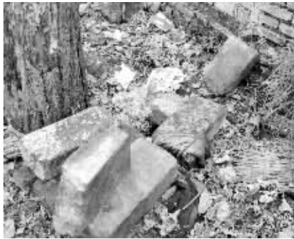
围墙附近散落的明城砖