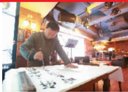
书画家张正海现场挥毫泼墨