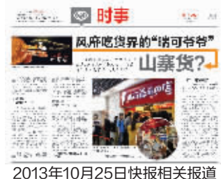
2013年10月25日快报相关报道