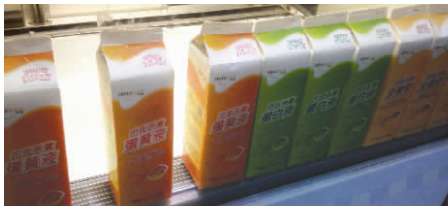
新街口瑞可爷爷的蛋糕被指用化学添加剂,这是店面柜台摆放的各类蛋液