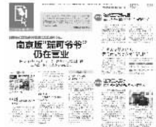
2013年10月26日快报相关报道

去年10月,有网友爆料称,在上海、南京、杭州、福州等地受到热捧、需长时间排队的烘焙店“瑞可爷爷”涉嫌山寨,并非日本正宗的“Rikuro”品牌。“很多市民可能被蒙在鼓里,排队数小时买了山寨货。”对此,日本“Rikuro”回应称,在中国并无分店,而总部设在上海的“瑞可爷爷”管理方则完全“失语”,拒不回应相关质疑。