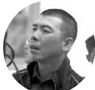
冯小刚终于能松口气了