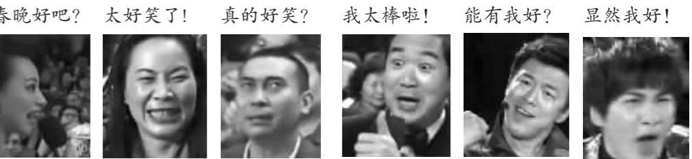
春晚好吧? 太好笑了! 真的好笑? 我大棒啦! 能有我好? 显然我好!

春晚的先导片里有个片段,一群年轻人以“吐槽”春晚为乐。昨晚,微博上一大群网友又把春晚给“玩了”。比如新上任的主持人张国立,他的一个竖大拇指的表情就被网友们争相转发,“哈哈!这用作点赞情实在太好啦,今年绝对要火的节奏。”不少网友表示,如今的春晚通过网络增加了更多互动性,让以往观众看春晚变成了网民玩春晚。