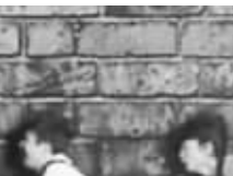
开心麻花带来的侧躺剧

光有新人还不行,得配上新的节目形式。这就像大厨做菜,光有新的原料还不够,得用全新的手法来烹饪。所以,在春晚这桌菜中,观众们首次看到了一些全新的节目形式,令人大开眼界。其实,春晚年年都在喊创新,今年真是做到了骨子里。