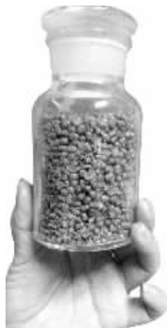
曾查获的违禁品绿豆,里面生出很多虫,现已被做成标本,置于南京检验检疫部门在禄口机场的办公室。