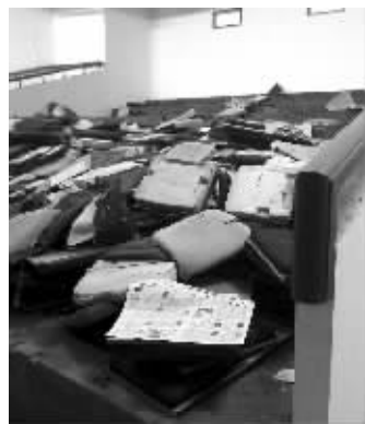
2013年时的解放电影院

挡,可以看到熟悉的门脸,斑驳的墙壁上,线条柔美,具有中西合璧的民国范儿。“那就是解放电影院,去年开始拆的,据说不拆了,要保留下来。”解放电影院对面是一溜店铺,一位售货员对记者说。