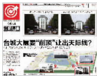
现代快报2013年9月11日相关报道