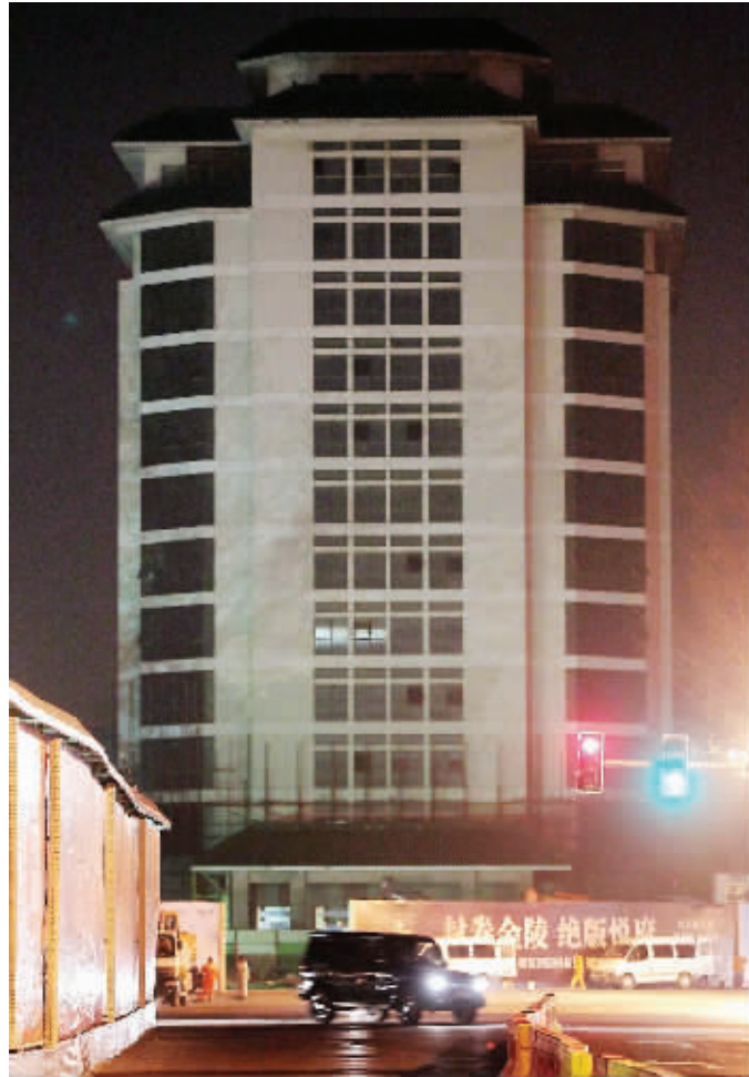
昨晚,记者在现场看到台城大厦已围挡施工

据介绍,台城大厦等高层建筑实施降层后,将有利于片区整体风貌的打造,有利于城市空间品质的提升,有利于钟山风景名胜区的塑造,将成为城市特色意图区内严格执行控高要求的表率工程。