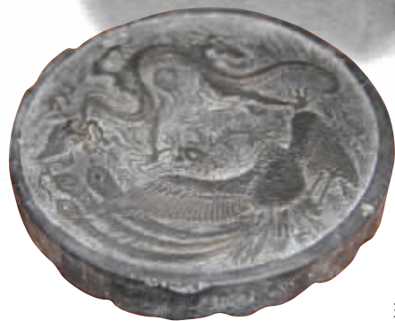
安徽贡墨“龙凤呈祥”

散发阵阵檀香香气的名医匾额，详细记录着病症的民国处方笺……继2012年底向社会广发“英雄帖”后，江苏省中医药博物馆已经征集到1863件有关中医中药的老物件。昨天，现代快报记者前往南京中医药大学图书馆提前探宝，看到瓷器、砚台、药墨、匾额等中医药文物摆了满满一屋。江苏省中医药博物馆将于今年10月15日南京中医药大学60周年校庆日正式开馆。目前，文物还在征集中，市民如果有意，可登录“江苏省中医药博物馆官网”献宝。