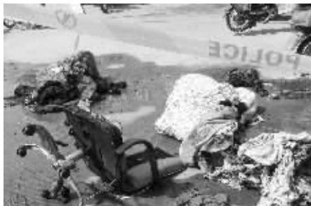
越南妻子放火烧家,损失不大