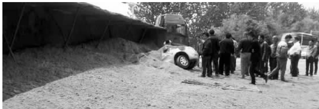
轿车被埋,救援工作持续了两个多小时