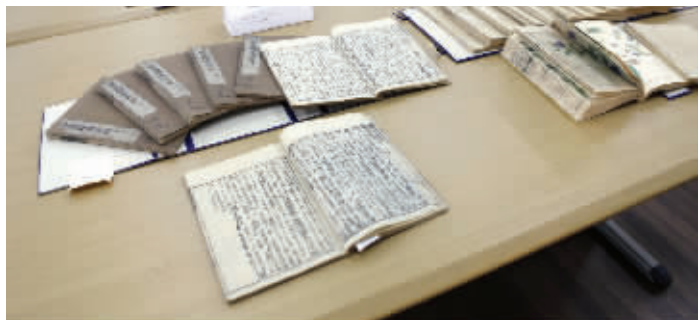
珍藏馆里收藏了宋、元、明、清等不同历史时期的古籍版本

光绪32年5月17日,力钧给慈禧看病后,发现“皇太后脉息左关弦急,右关濡滑,肝旺由于胆热,胃