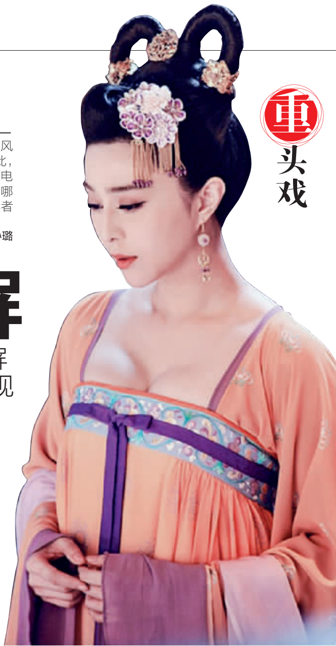
范冰冰饰演的武则天