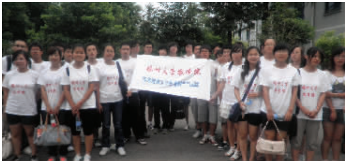
学生们2011年参加暑期社会实践时的合影

据了解,4年来,该班7名学生在省级以上期刊发表学术论文11篇,多人辅修第二专业。