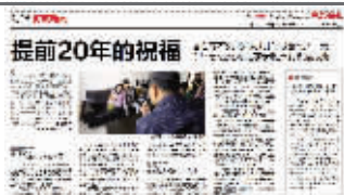
现代快报相关报道