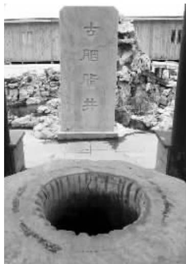
古胭脂井遗址 资料图片