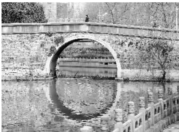
南京市区的竺桥

竺桥、胭脂井……这些在我们身边的历史遗存都成“不可移动文物”了。昨天，南京文广新局官微“@南京文化发布”公布了玄武区第一批不可移动文物名单，一共66处。这一批公布的名单既有六朝宫城遗址，也有南朝末代皇帝躲避隋朝大军的“胭脂井”，还有明朝驸马梅殷淹死的竺桥。