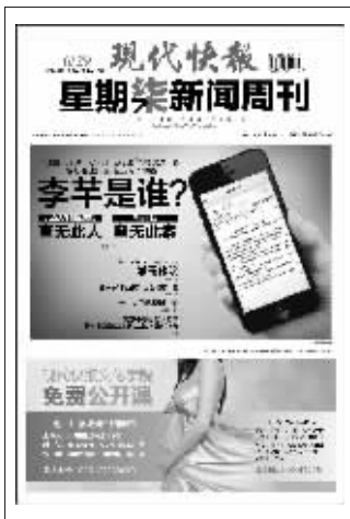
(上期星期柒新闻周刊封面)