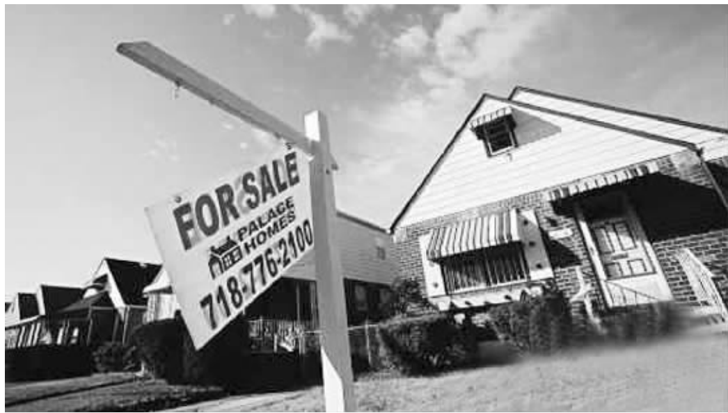
美国纽约皇后区,一栋挂着出售牌的住宅

中国人在美国买房的成交价中值为每套52.3万美元,而全美现房成交价中值为19.9万美元。尽管加拿大人在美国的购房套数超过中国人,但成交价中值仅为21万美元。